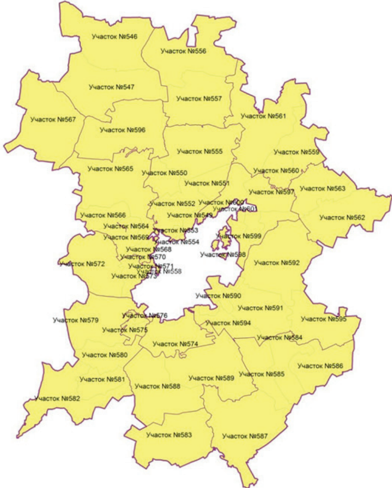
Графическое изображение границ избирательных участков, участков референдума на территории Орловского района

Приложение 2 к постановлению администрации Орловского муниципального округа Орловской области от 28 апреля 2025 года № 1167